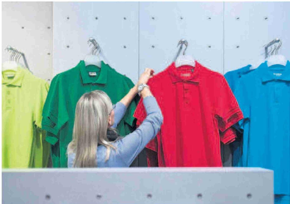
Die berufliche Situation von Frauen ist facettenreich geworden, so dass gewisse Privilegien altmodisch wirken.

Das Bundesamt für Sozialversicherungen wirbt mit deutlichen Worten für die Anhebung des Frauenrentenalters